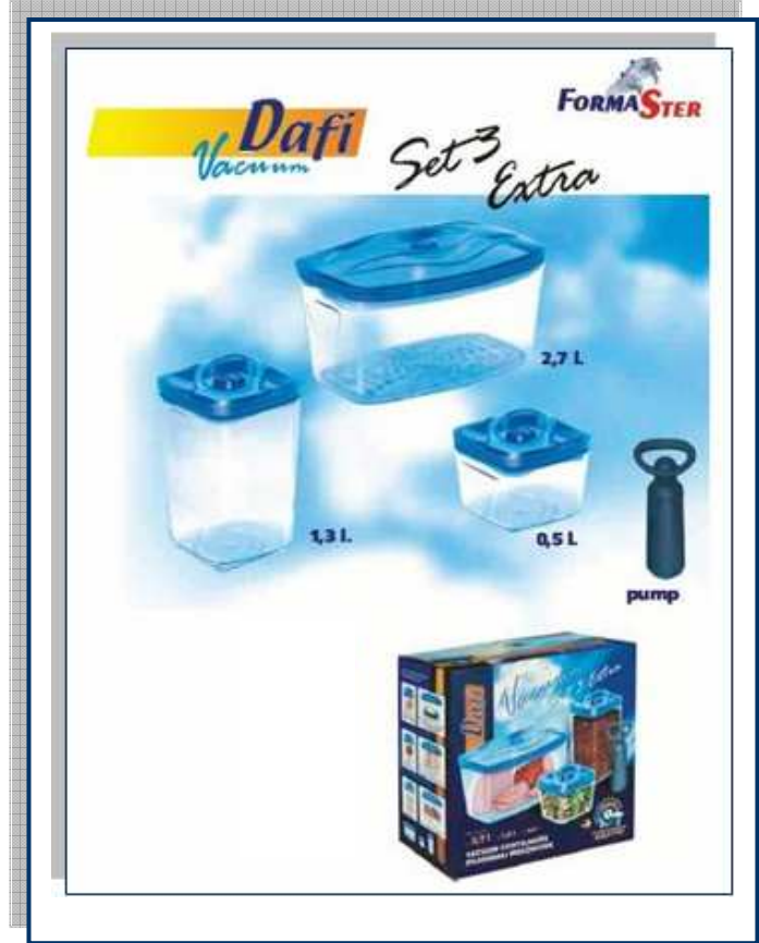
Set 3 Extra